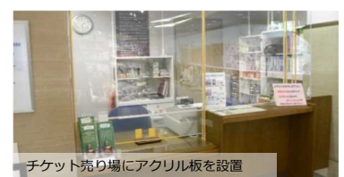
チケット売り場にアクリル板を設置