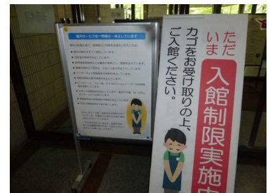
データ：県立図書館提供