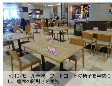
イオンモール草津 フードコートの椅子を半数にし、座席の間引きを実施