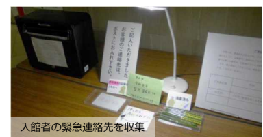
入館者の緊急連絡先を収集