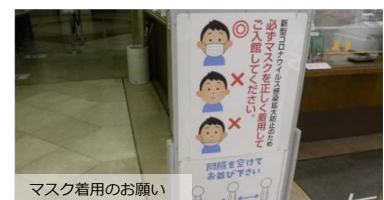
マスク着用のお願い