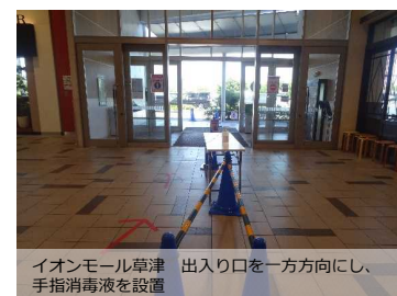
イオンモール草津 出入口を一方方向にし、手指消毒液を設置