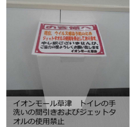
イオンモール草津 トイレの手洗いの間引きおよびジェットタオルの使用禁止