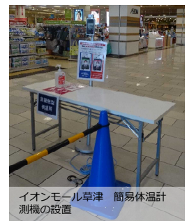
イオンモール草津 簡易体温計測機の設置