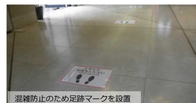
混雑防止のため足跡マークを設置