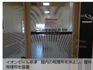
イオンモール草津 館内の喫煙所を休止し、屋外喫煙所を設置